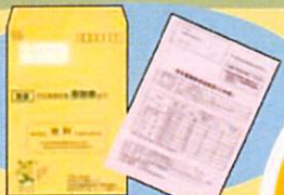
(国保 特定健診受診券)