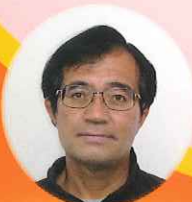
宗 茂さんも歩きます! (元マラソン日本代表選手)