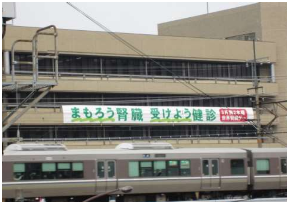
2013.3知事定例記者会見