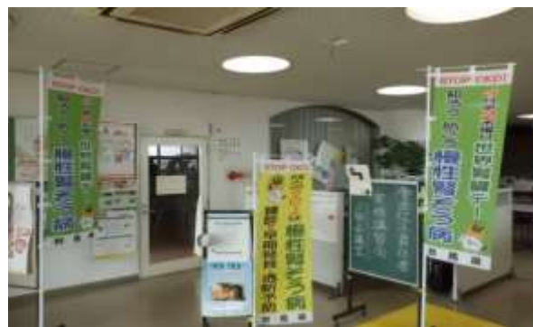
藤岡保健福祉事務所