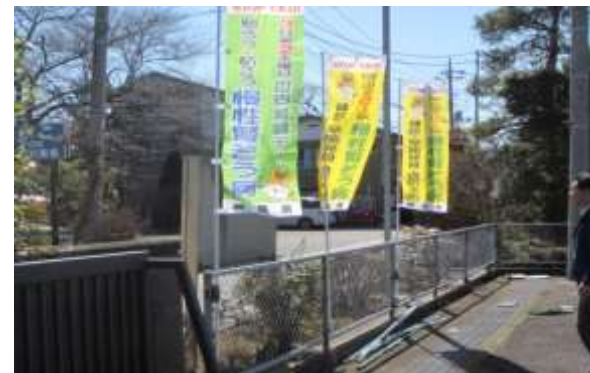
吾妻保健福祉事務所